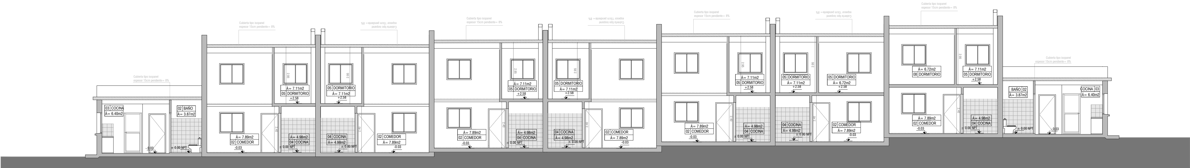
CORTE LONGITUDINAL BLOQUE D escala 1/100