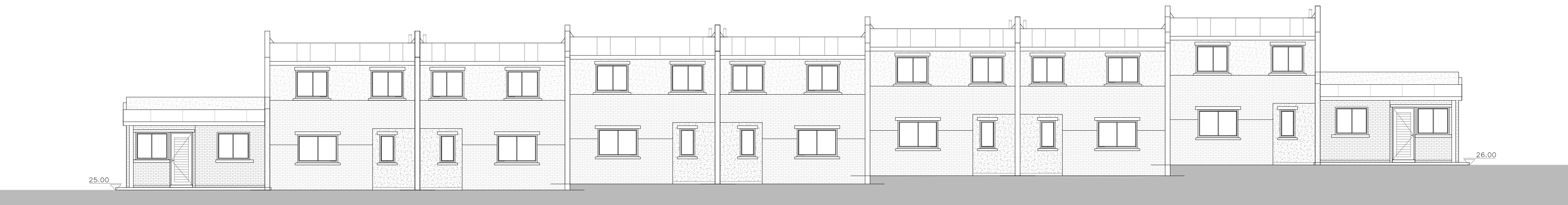
PERFIL CALLE MAZARINO escala 1/100